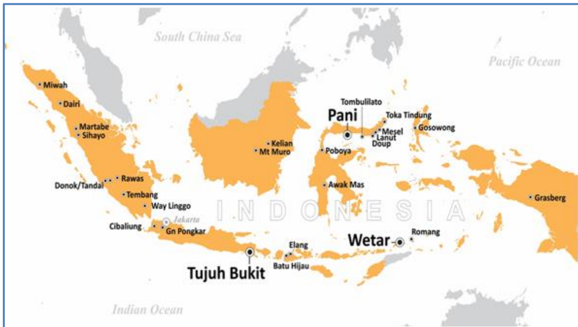
Gambar 1: Daerah Kegiatan Eksplorasi yang Dilakukan oleh Merdeka di Indonesia

Adapun total biaya yang dikeluarkan untuk mendukung seluruh kegiatan eksplorasi yang dilakukan Merdeka di Indonesia selama bulan Oktober 2019 adalah sebesar Rp37 miliar.