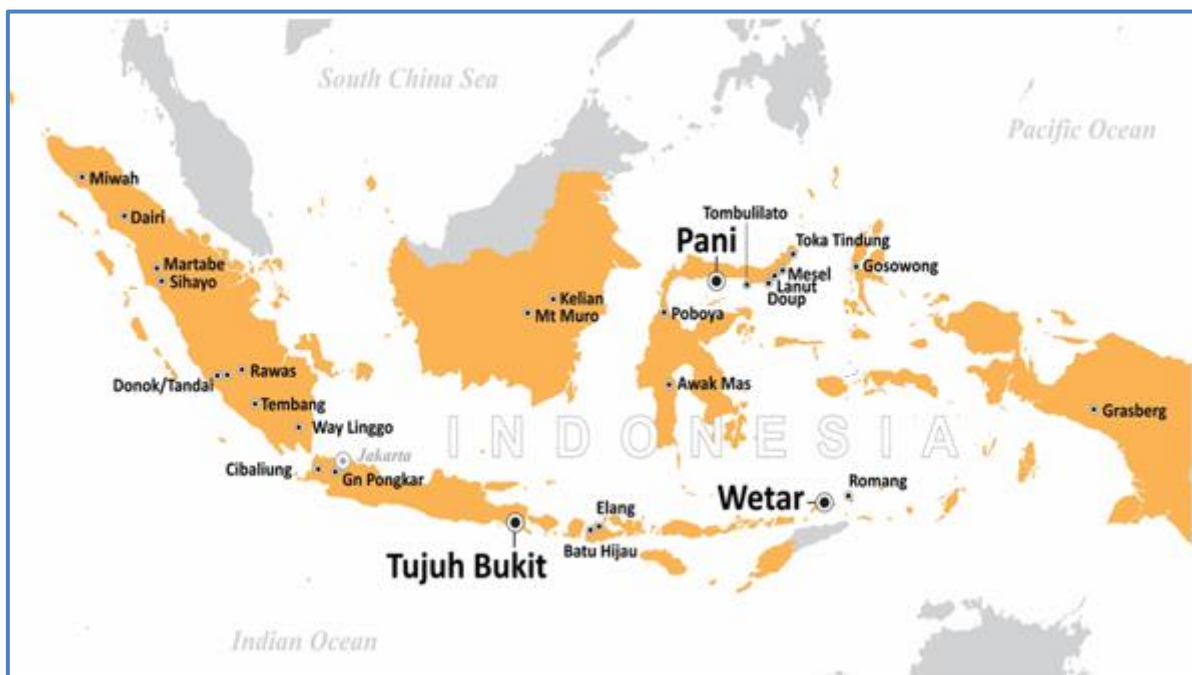
Gambar 1: Daerah Kegiatan Eksplorasi yang Dilakukan oleh Merdeka di Indonesia

Adapun total biaya yang dikeluarkan untuk mendukung seluruh kegiatan eksplorasi yang dilakukan Merdeka di Indonesia selama bulan Januari 2020 adalah sebesar Rp27,5 miliar.