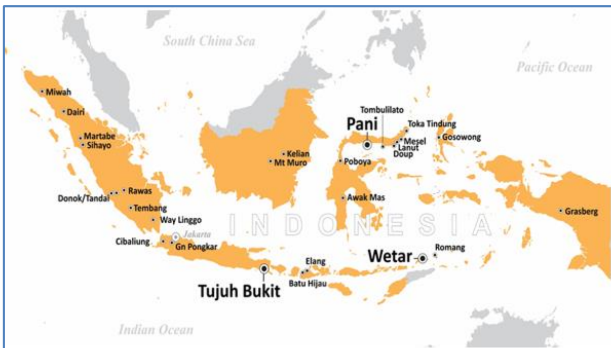
Gambar 1: Daerah Kegiatan Eksplorasi yang Dilakukan oleh Merdeka di Indonesia

Adapun total biaya yang dikeluarkan untuk mendukung seluruh kegiatan eksplorasi yang dilakukan Merdeka di Indonesia selama bulan September 2020 adalah sebesar Rp16,45 miliar.