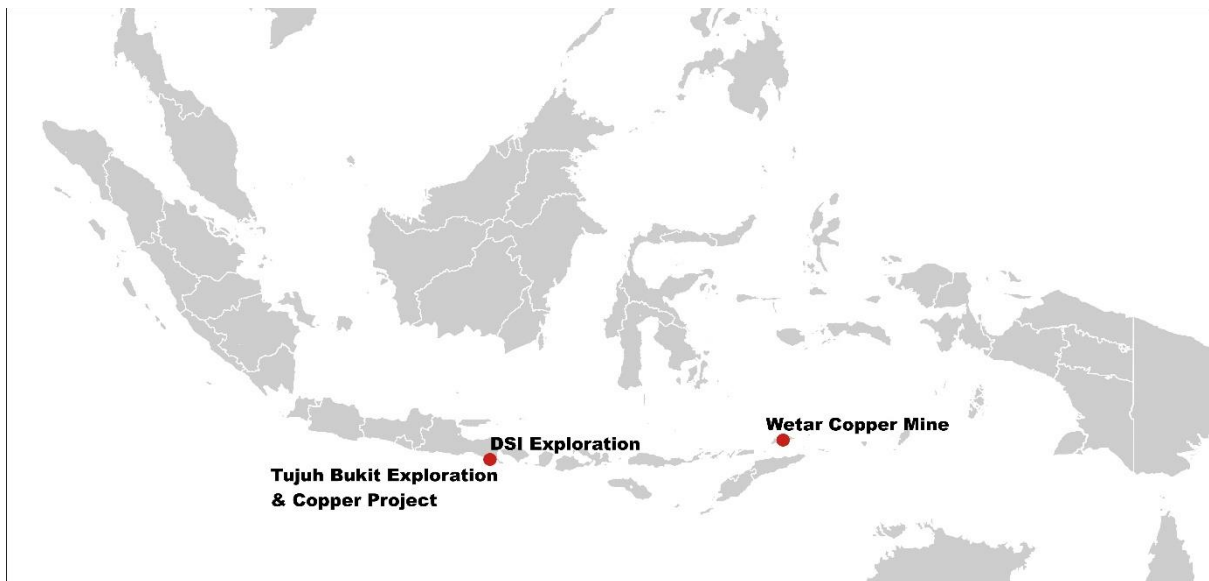
Gambar 1: Lokasi Proyek Eksplorasi Merdeka Figure 1: Merdeka Exploration Project Locations

The total spending on exploration by Merdeka in Q1 is approximately IDR51.84 billion (equivalent to approximately US$3.07 million).